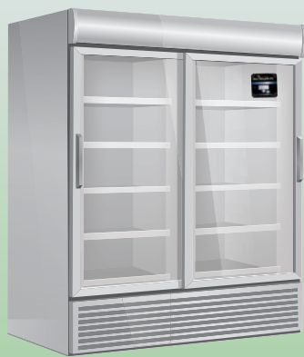
Ihre kritischen Geräte